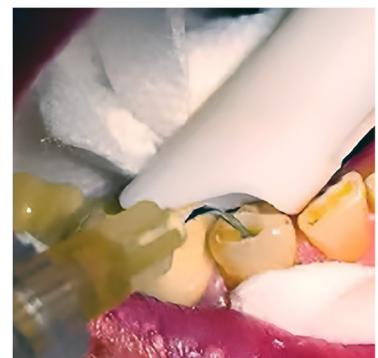
Afb. 03 - Kanaal werd geïrrigeerd met steriel zoutoplossing om alle irrigatiemiddelen en debris te verwijderen.