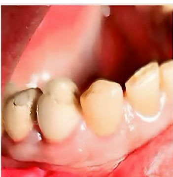
Afb. 01 - Preoperatief beeld met een normale occlusie.

Voor deze procedure is gekozen voor een bioactieve minerale wortelkanaalsealer, BioRoot Flow van Septodont. Volgens Septodont is dit een unieke harsvrije (geen krimp), zeer zuivere calciumsilicaatformule die de vorming van hydroxyapatiet bevordert.