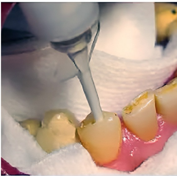
Fig. 04 - BioRoot® Flow spuitpunt werd zo ver mogelijk in het kanaal geplaatst en vervolgens 2 mm teruggetrokken.

Een verwarmde 27 mm lange obturator op drager nr. 25 werd vervolgens langzaam in het kanaal geplaatst tot een werklengte van 27 mm (afbeelding 6). Het handvat en de overtollige obturator werden gescheiden en verwijderd met een Great White No. 2 hogesnelheidsboor.