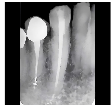
Afb. 07 - Definitieve röntgenfoto die een succesvolle wortelkanaalbehandeling laat zien.

Het toegangsgat werd gerestaureerd met schaduw A2 van SDI's Luna Flow flow flowable composiet samen met Kuraray's CLEARFIL Universal Bond Quick. Het composiet werd gevormd met composiet finishing burs en gepolijst met Jazz polijstmachines. Er werd een definitieve röntgenfoto gemaakt (afbeelding 7) waarop een succesvol geobtureerd wortelkanaalsysteem te zien was. De patiënt meldde geen pijn of koudegevoeligheid na de behandeling van tand nr. 27.