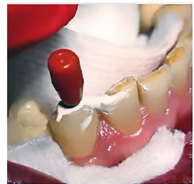
Afb. 06 - De obturatie op dragerbasis werd langzaam in het kanaal geplaatst tot een werklengte van 27 mm.