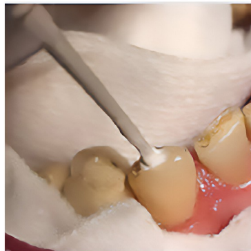
Afb. 05 - BioRoot® Flow werd geïnjecteerd terwijl tegelijkertijd de spuitpunt uit het kanaal werd teruggetrokken.